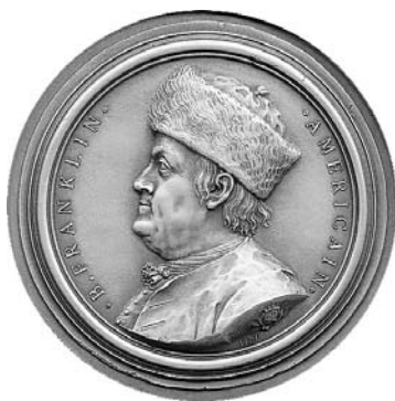
Benjamin-Franklin , médaillon de terre cuite par J.-B. Nini, 1777, dont un exemplaire est au Musée d'Orléans.

En fait, selon les époques, les Américains ont eu des représentations assez contradictoires de celui qui, par ses réalisations, ses engagements et ses luttes, est un modèle fondateur de notre humanité.